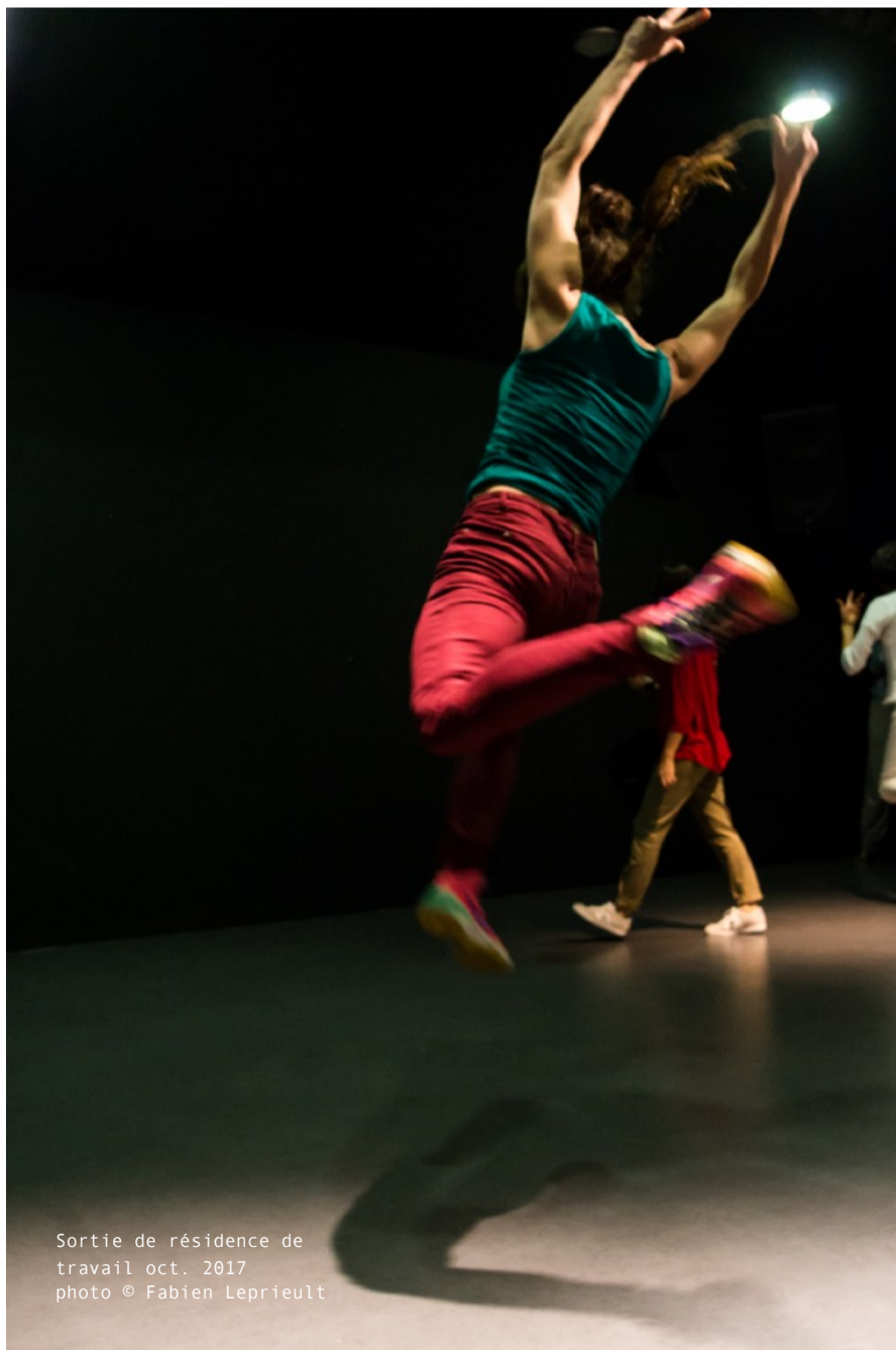
Sortie de résidence de travail oct. 2017

> Version longue [32'] https://vimeo.com/234465003 [mot de passe : rco]