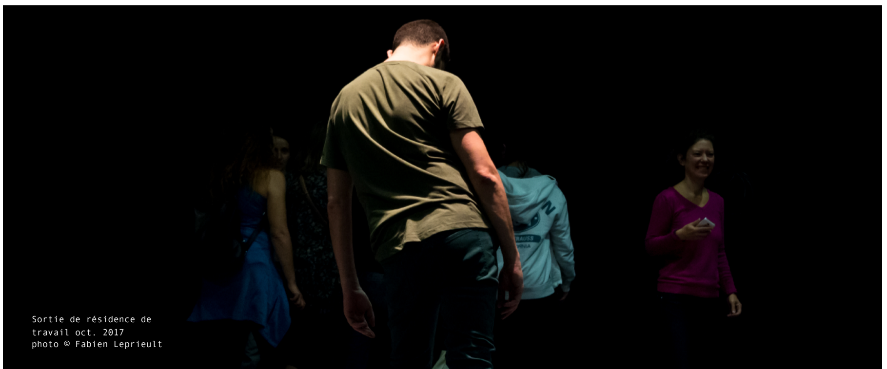
Sortie de résidence de travail oct. 2017

Le but est d'articuler les liens qui se sont tissés entre le public-participant et la performance dansée à travers la technologie et de comprendre comment la composition in situ a été reçue par ce public-participant.