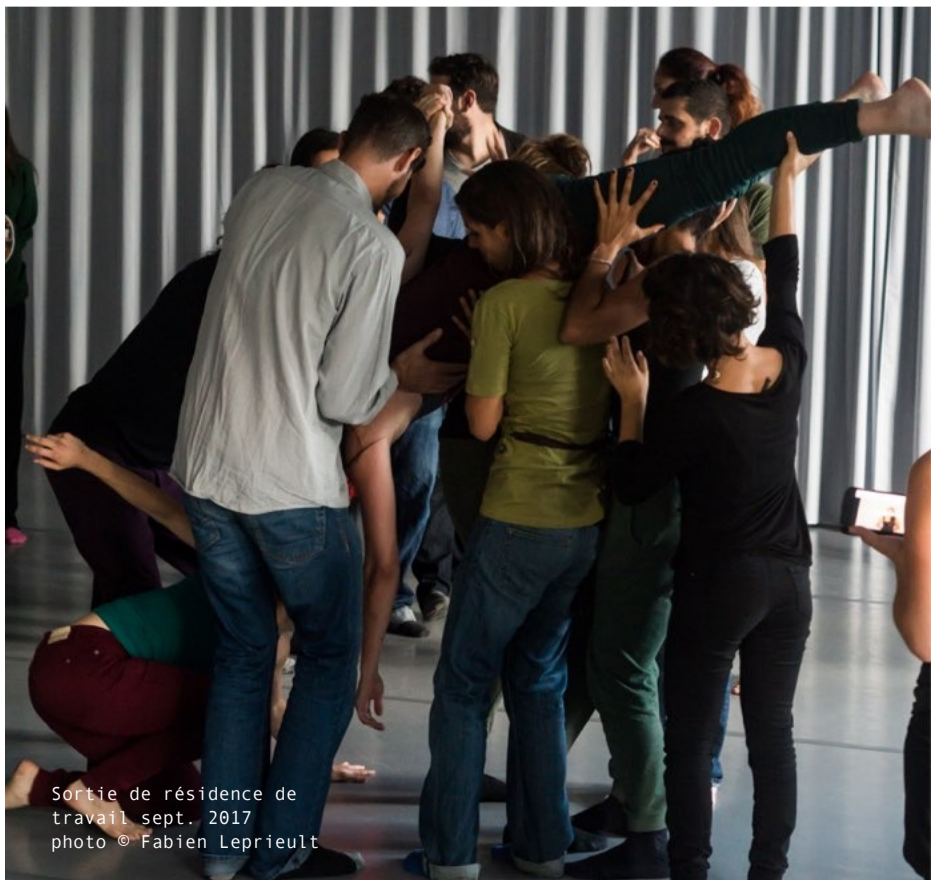
Sortie de résidence de travail sept. 2017