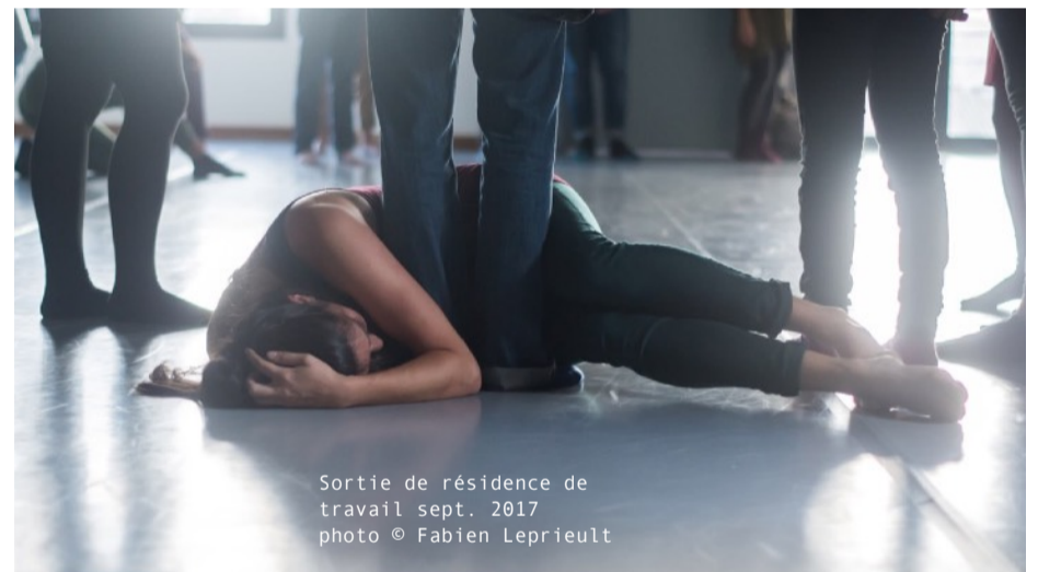
Sortie de résidence de travail sept. 2017