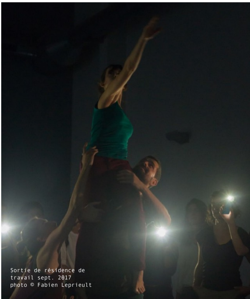
Sortie de résidence de travail sept. 2017