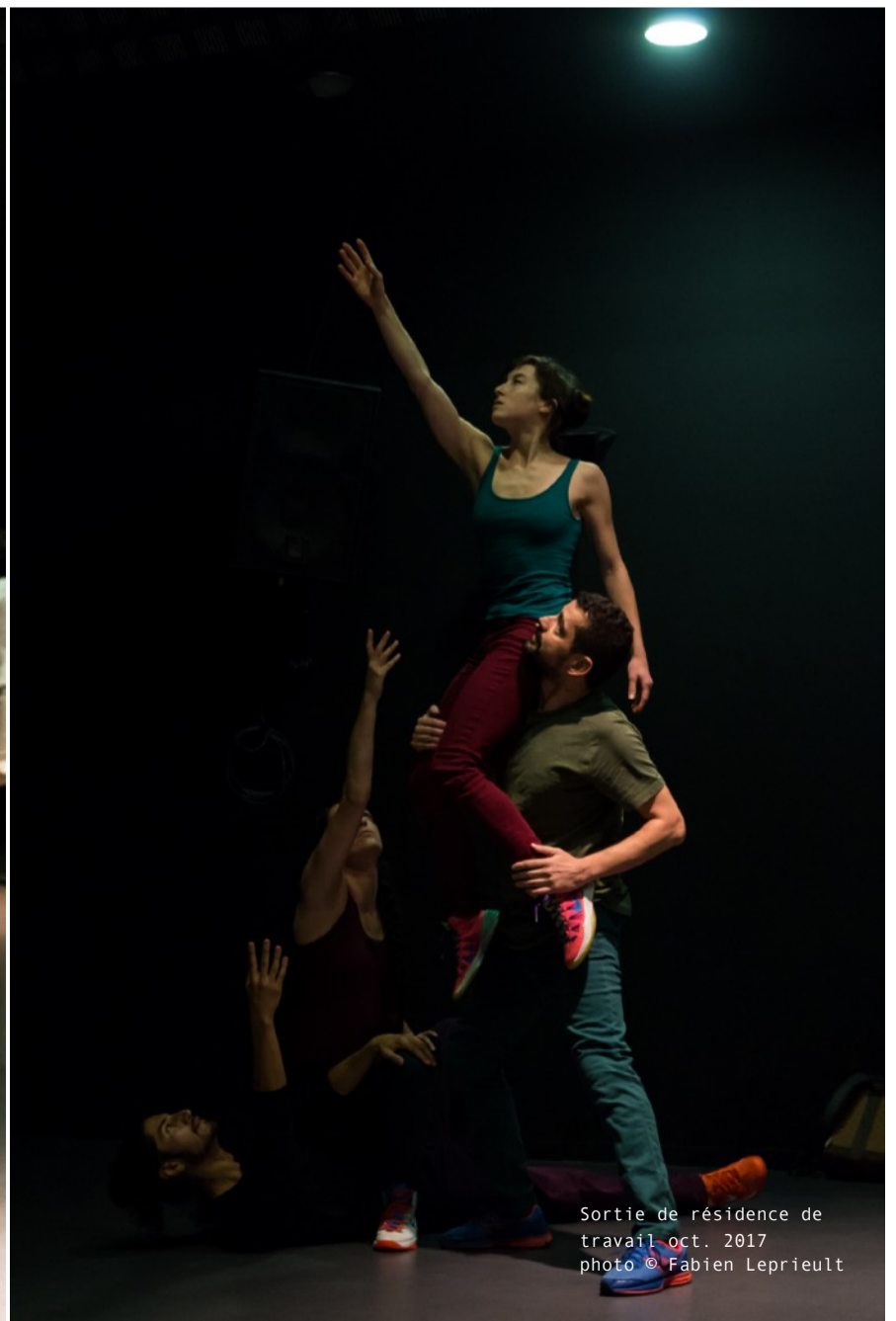
Sortie de résidence de travail oct. 2017